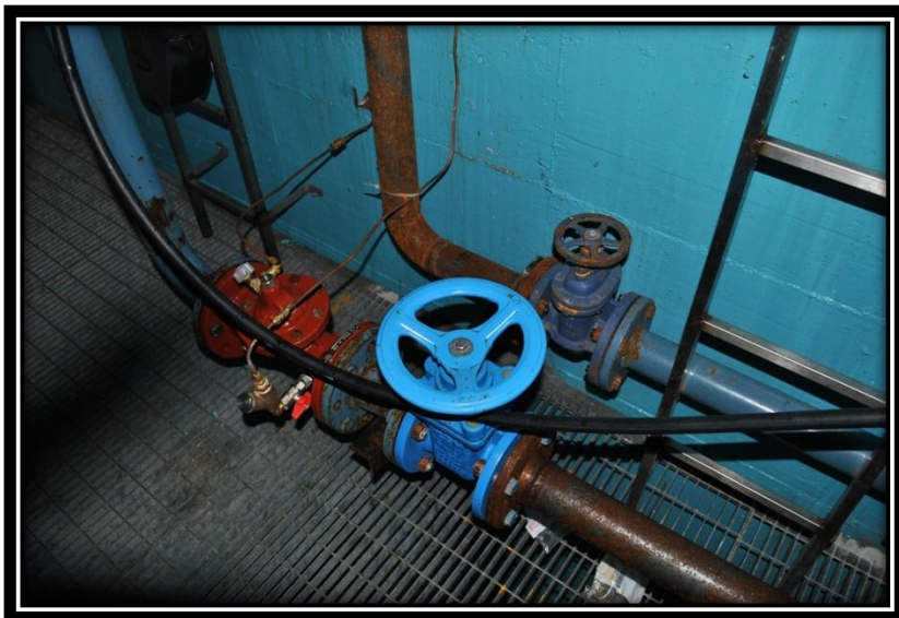
Figura 13 Camera di manovra di Ruvere con l'alimentazione dal troppo pieno di Allesaz e dallo stacco del Chasten con valvola