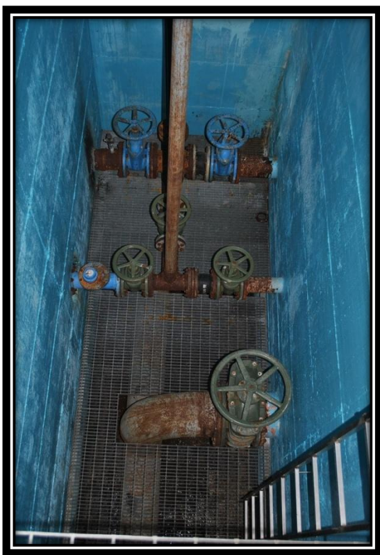
Figura 14 Dettaglio camera di manovra di Ruvere con le distribuzioni