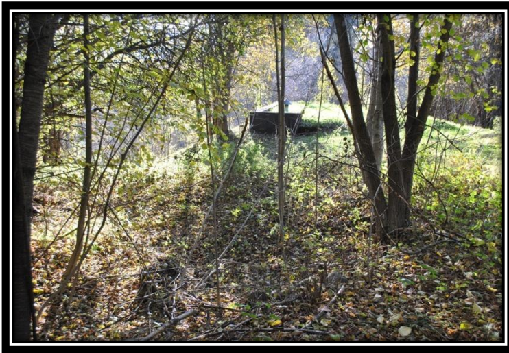
Figura 10 La vasca di Ruver