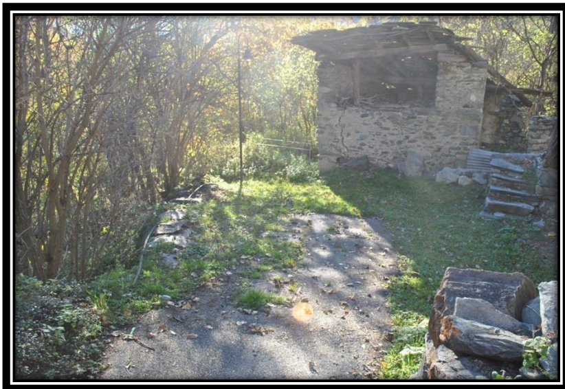
Figura 7 Termine della strada interna di Moussanet e inizio del bosco per il passaggio condotta a collegare la vasca di Ruvere