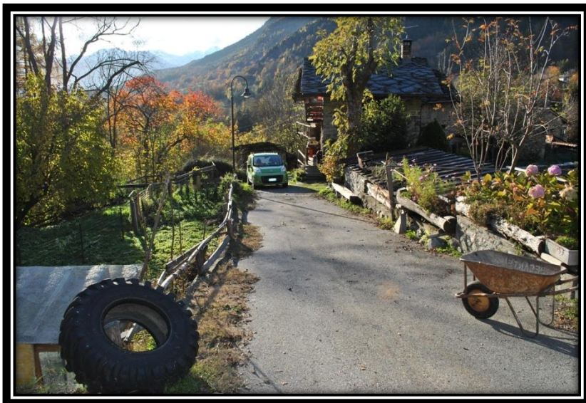
Figura 5 Strada interna a Moussanet sotto cui posare la nuova adduzione per la vasca di Ruvere