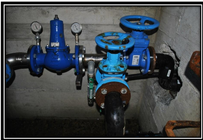
Figura 3 Gruppi di intercettazione e riduzione pressione all'interno del pozzetto sulla strada tra Moussanet e Tollegnaz