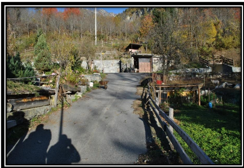
Figura 6 Vista dal basso della strada di Moussanet su cui creare una trincea di posa della nuova condotta per la vasca di Ruvere