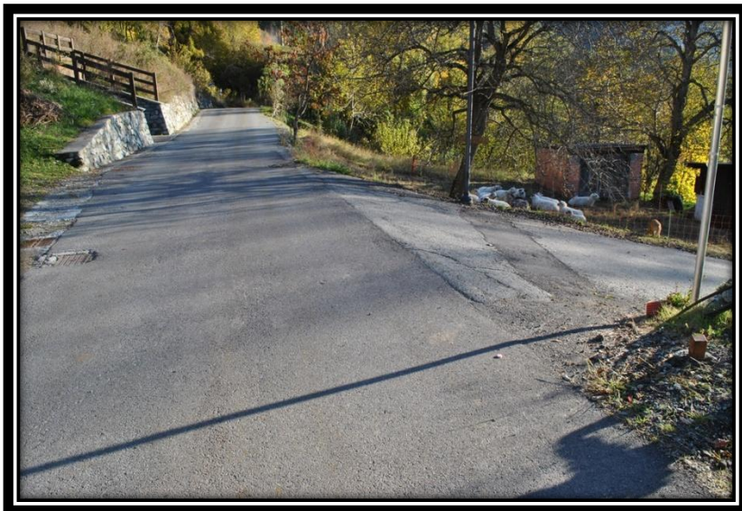
Figura 4 Intersezione tra la strada per Tollegnaz e la strada di penetrazione a destra per Moussanet viste dal pozzetto