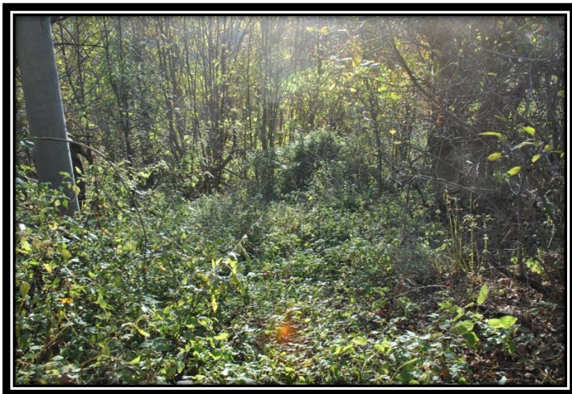
Figura 8 La folta vegetazione della zona umida a monte della vasca di Ruvere