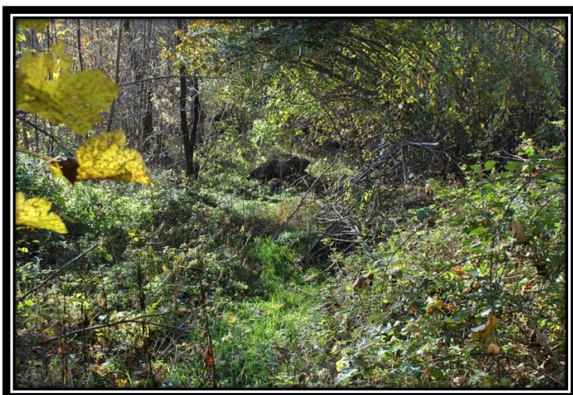
Figura 9 Vista dal basso del percorso della nuova tubazione nel bosco a collegare il pozzetto superiore con la sottostante vasca