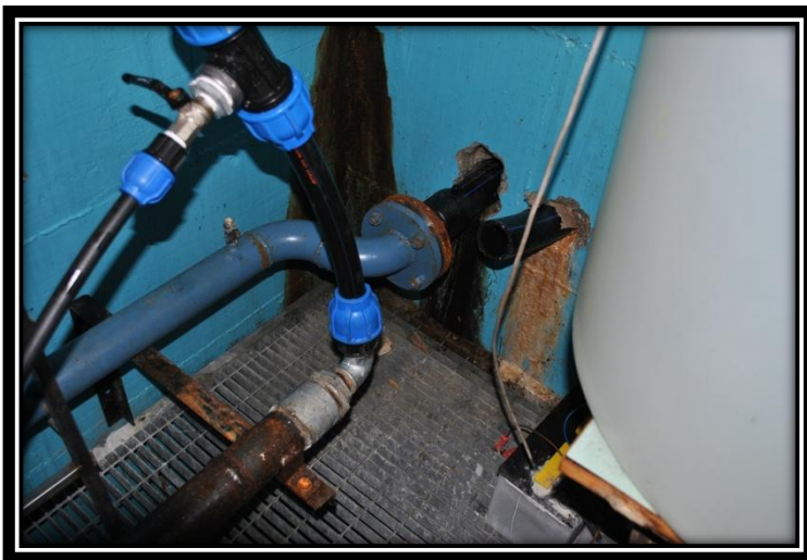
Figura 12 Vista della camera di manovra di Ruver con il tubo tranciato dell'alimentazione dismessa